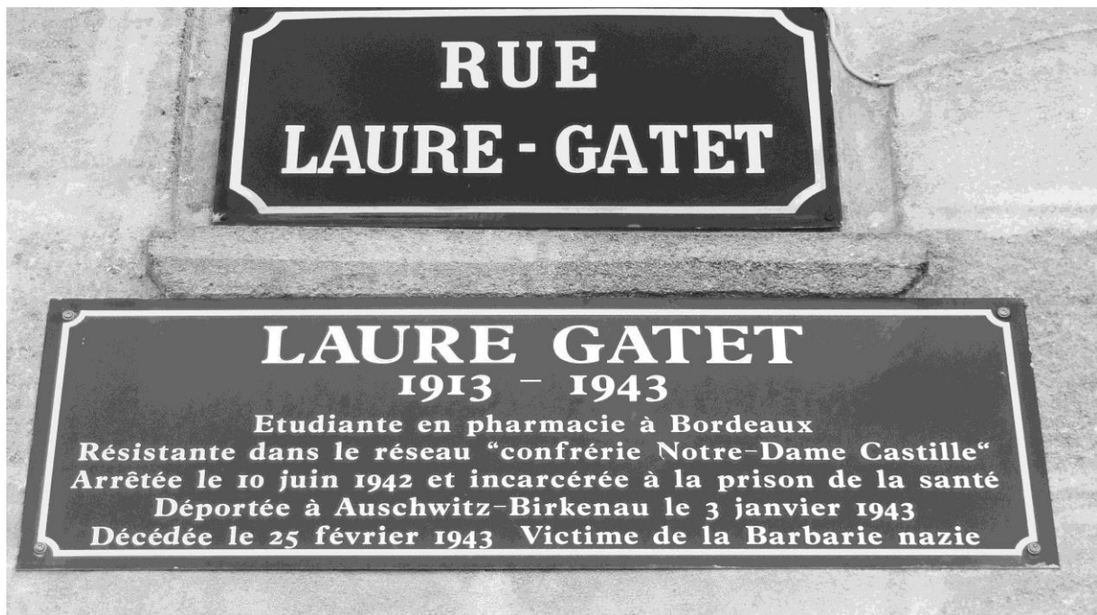
Plaque de rue Laure Gatet à Bordeaux.